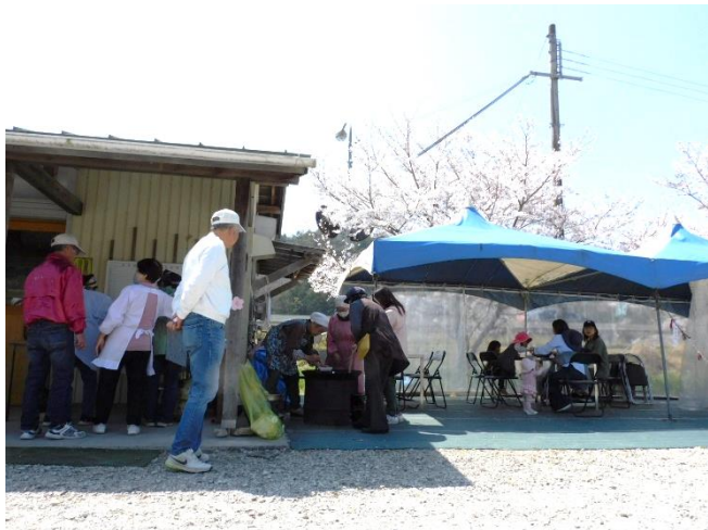
さくら祭りの様子

満開の桜の中、4月1日(土)、芳田ふれあい直売所でさくら祭りとふれあいBBQの集いがありました。ふれあいBBQには5家族21名の参加があり、子どもも大人もみんな楽しそうでした。