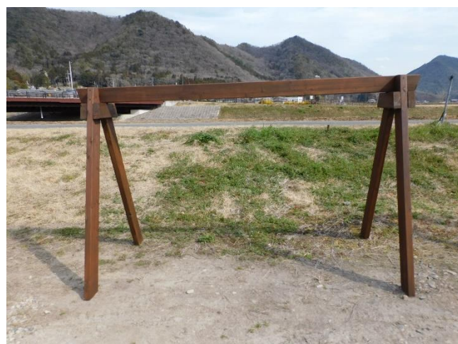
完成したサイクルスタンド

産業・観光部会の中に器用な方がいて、写真のようなサイクルスタンドを6台作製、いちご園などに設置しました。