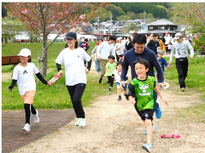
野間川芳田公園をスタート

4月16日(日)、いちごの里親子マラソンが開催されました。今回で2回目の開催。33家族122名の参加で、中には阪神方面から参加された方もありました。