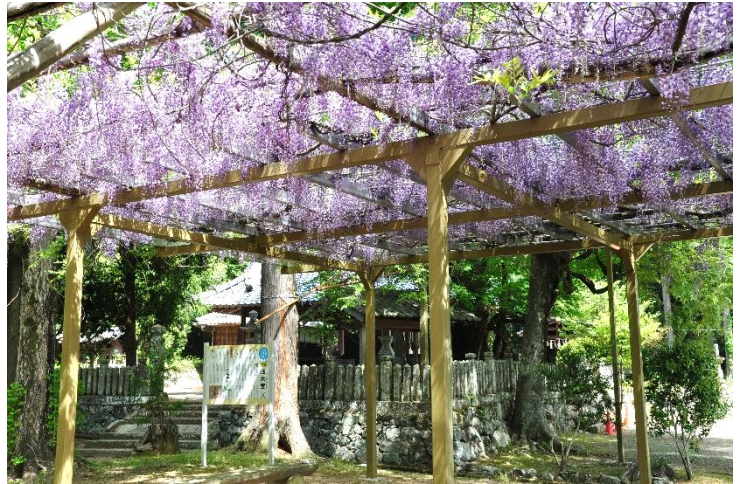
明楽寺町 六所神社のフジ