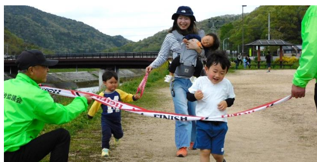
ゴール！ がんばった！